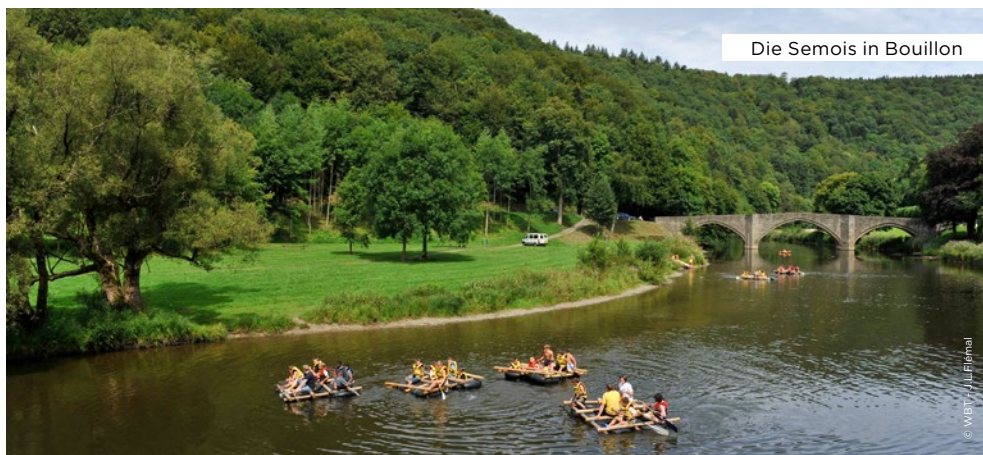
Die Semois in Bouillon