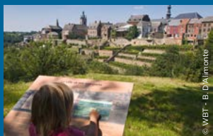
Het uitzicht op de hangende tuinen

Waarom zou je niet profiteren van deze groene parel om enkele schitterende souvenirs mee naar huis te nemen? Laat je gaan op je selfies met: