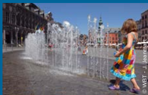
Op de Square Saint-Germain terwijl je even halt houdt bij de vergulde engelenvleugels!