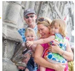
© V. Lathoms - G. P. H. H. H.