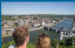
Aan de klokkentoren van het Minderbroederklooster