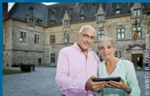
De uitstekende rots aan het Kasteel