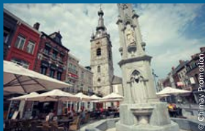
De fontein aan de Collegiale kerk