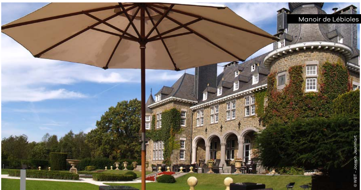
Manoir de Lébioles

Rue Xhrouet 39 • 4900 Spa lepetitmaur.com