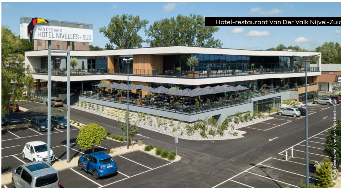
Hotel-restaurant Van Der Valk Nijvel-Zuid

Rue de Baudémont 50 • 1460 Ittre baudemont.be