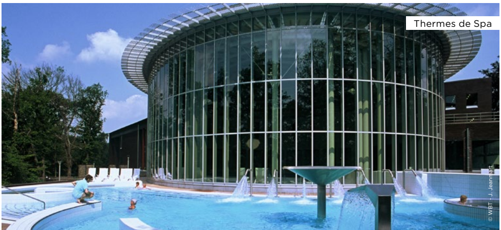
Thermes de Spa