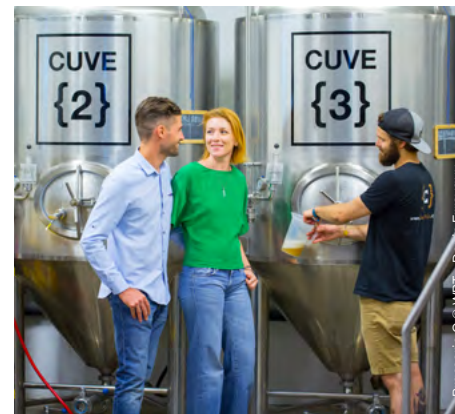
Brasserie C