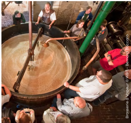
Brasserie à Vapeur