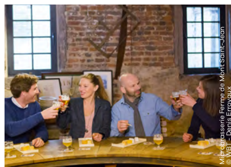
Microbrasserie Ferme de Mont-Saint-Jean