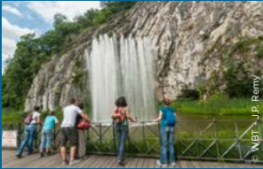
Vor der Antiklinale

Durbuy ist zwar die kleinste Stadt der Welt, sie ist aber auch eine der charmantesten. Mit ihren kurvenreichen Gässchen, in denen Sie auf vielerlei Geschäfte und wunderschöne Ecken und Winkel stoßen, ist sie ein idealer Ort, um Fotos zu machen: