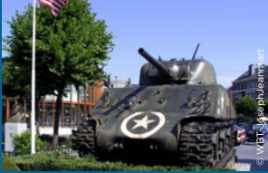
Sur le Mémorial du Mardasson