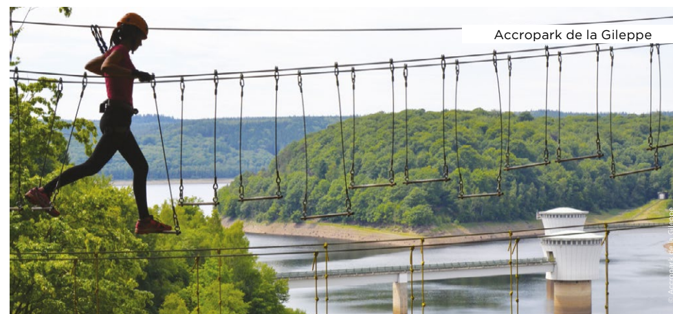
Accropark de la Gileppe

LAC DE WARFAAZ Route du Lac de Warfaaz - 4900 Spa www.lacdewarfaaz.be