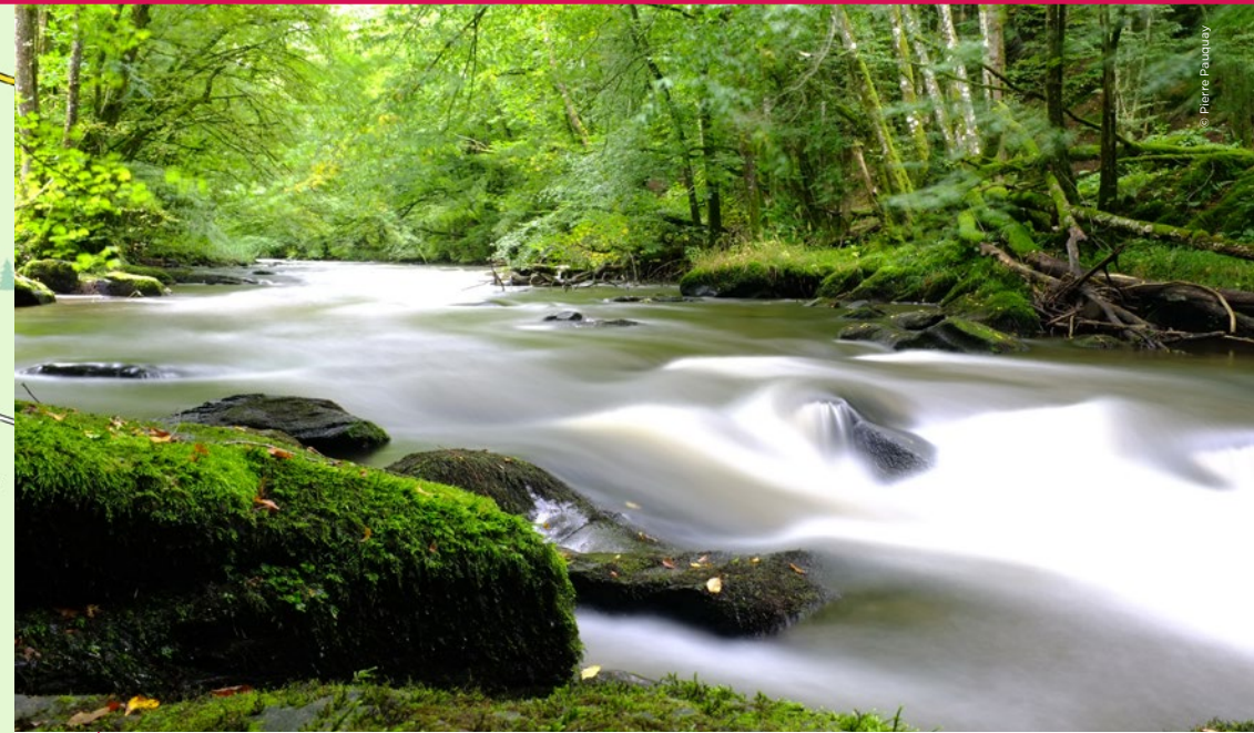
La Lesse, peu avant de rejoindre le hameau éponyme.