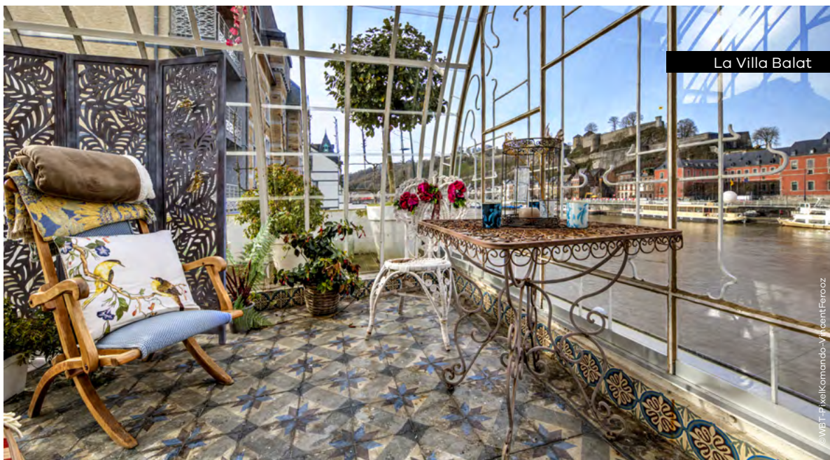
La Villa Balat

Rue du Premier Lanciers 10 • 5000 Namur all.accor.com