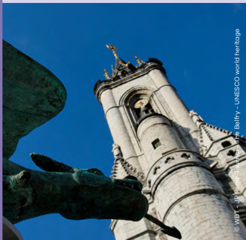
© WBT - J.P. Remy - Tournai - The Belfry - UNESCO world heritage

Lors de votre visite, prenez le temps de flâner sur les rives de l'Escaut et de boire un verre sur la Grand'Place , vivante et conviviale!