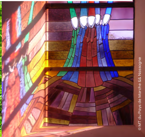
© MT du Pays de Marche & Nassogne