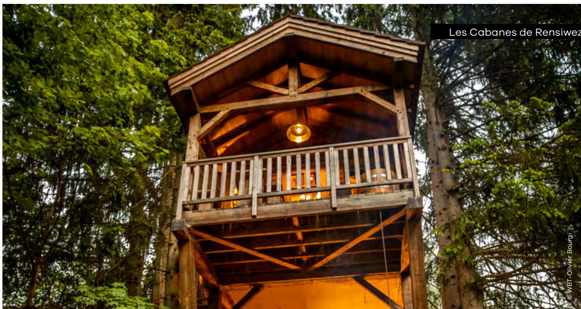
Les Cabanes de Rensiewez

Quartier de Lohan 1 • 6980 La Roche-en-Ardenne campinglohan.be