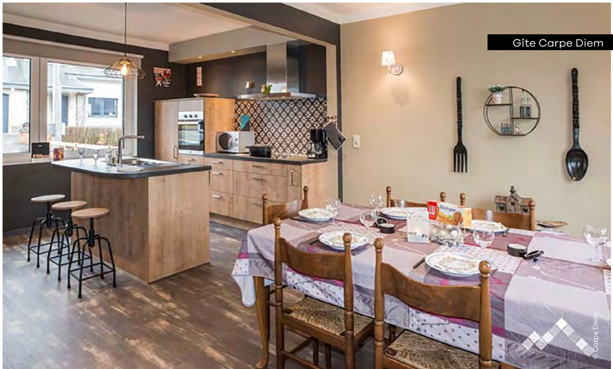
Gîte Carpe Diem

Rue Croix Blanche 24 • 6600 Bastogne carpediembastogne.be